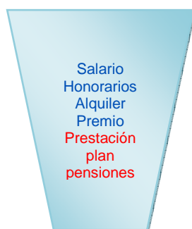
Base Imponible General